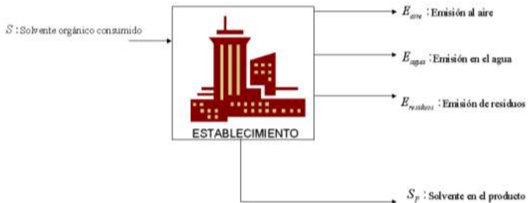
Diagrama 1 Balance sin equipo de control

Si E_{\text{aire}} es mayor al LMP de la tabla 1, las fuentes fijas no cumplen con los LMP.